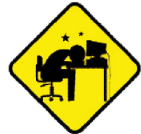
Stress Lavoro Correlato